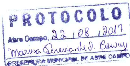
_____ Márcio Moreira Vítor Prefeito Municipal